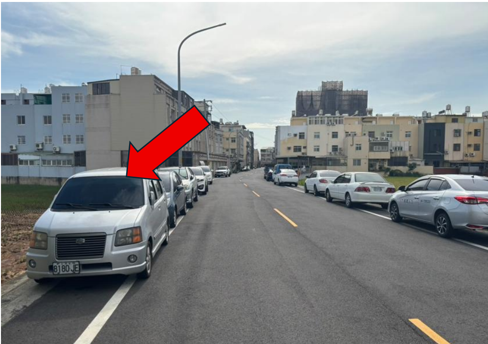
勘估標的臨路-仁宇路