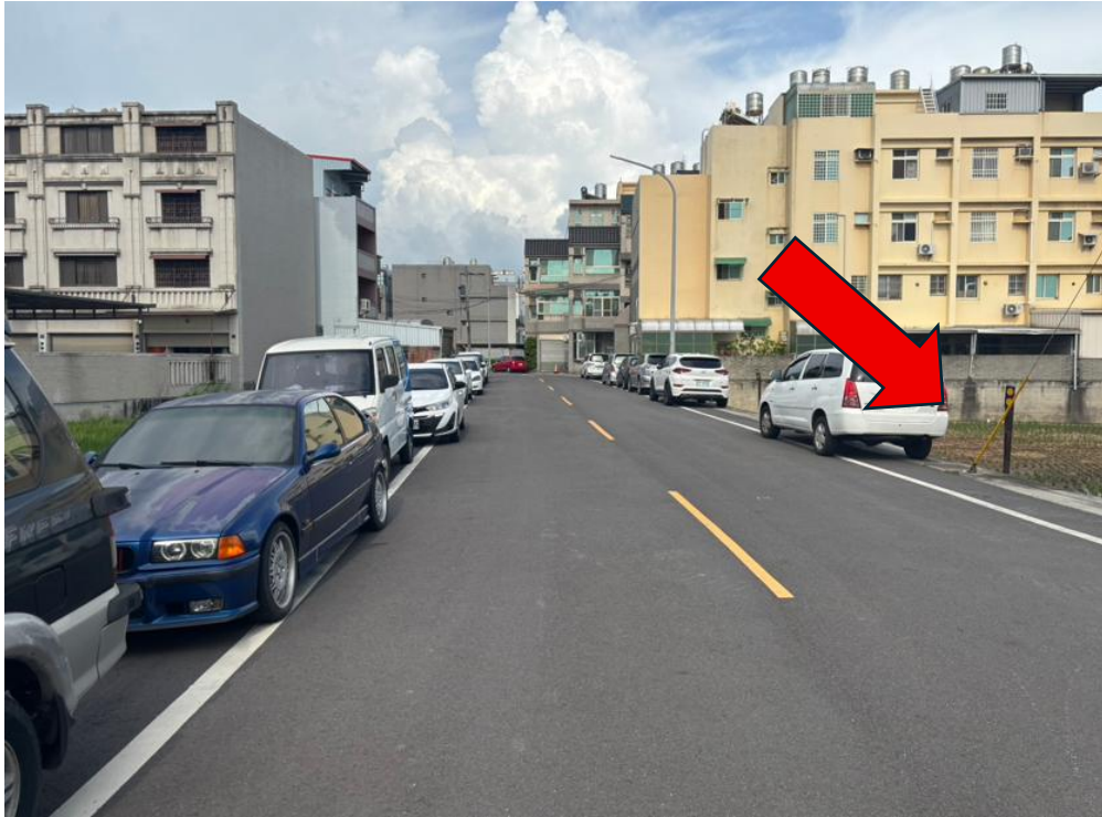
勘估標的臨路-仁宇路