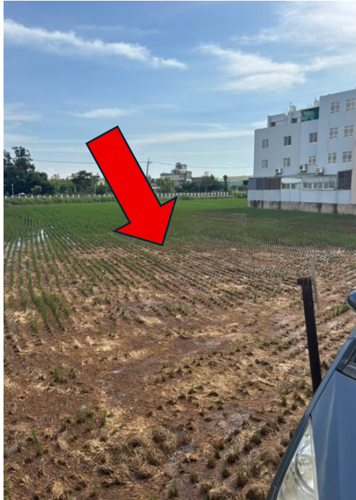
勘估標的土地外觀