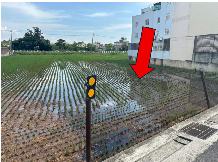
勘估標的使用現況